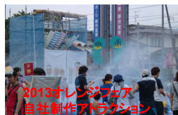
2013年8月にはカネタ建設様のオレンジフェアを訪問。刺激と衝撃と感動の連続でした。