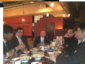
懇親会でも話題は尽きません！