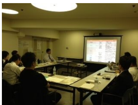
コダマホーム小玉社長の「コダマ祭」のお話しのシェアしたい情報が満載でした。