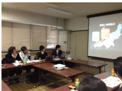
カネタ建設猪又社長のチラシづくりのお話しの釘付け。アイデアをシェアする方が続出です。