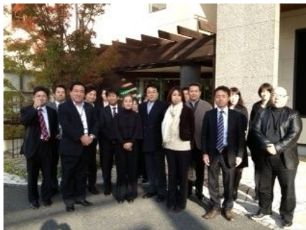
第3回のネストハウス石川社長のお話しの刺激を受け、シェア会メンバーで山口県を訪問。ショールームや展示場、施工現場を見学させていただきました。