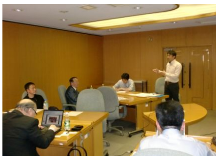
2012年5月、試行錯誤のなか、シェア会がスタートしました。