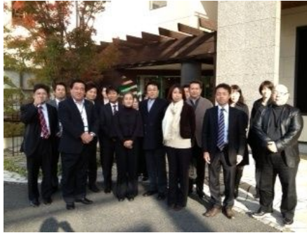
第3回の石川社長のお話しに刺激を受け、シェア会メンバーで山口県を訪問。ショールームや展示場、施工現場を見学させていただきました。