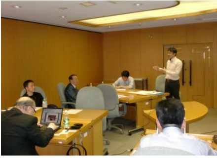
2012年5月、試行錯誤のなか、シェア会がスタートしました。