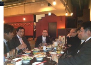
懇親会でも話題は尽きません！