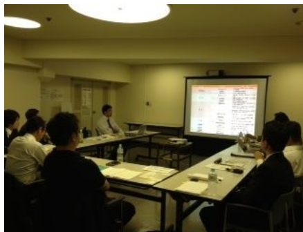
コダマ社長の「コダマ祭」のお話しにもシェアしたい情報が満載でした。