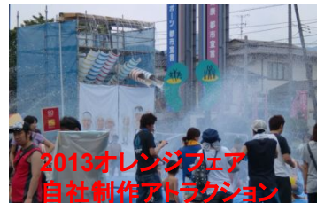
8月にはカナタ建設様のオレンジフェアを訪問。刺激と衝撃と感動の連続でした。